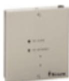
FSD-Adapter 115,00 €*