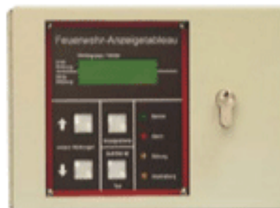
VdS-Nr. G 203086

Feuerwehr-Anzeigetableau nach DIN 14662, universell anschaltbar an Brandmeldezentralen unterschiedlicher Hersteller. Auch in redundanter Ausführung lieferbar!