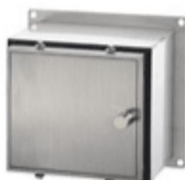
Rundumsabotageschutz FSD 400,- €*