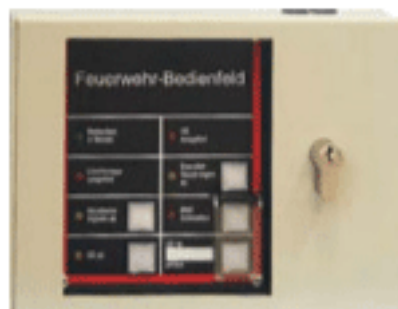
VdS-Nr. G 299034

Feuerwehr-Bedienfeld nach DIN 14661 universell anschaltbar