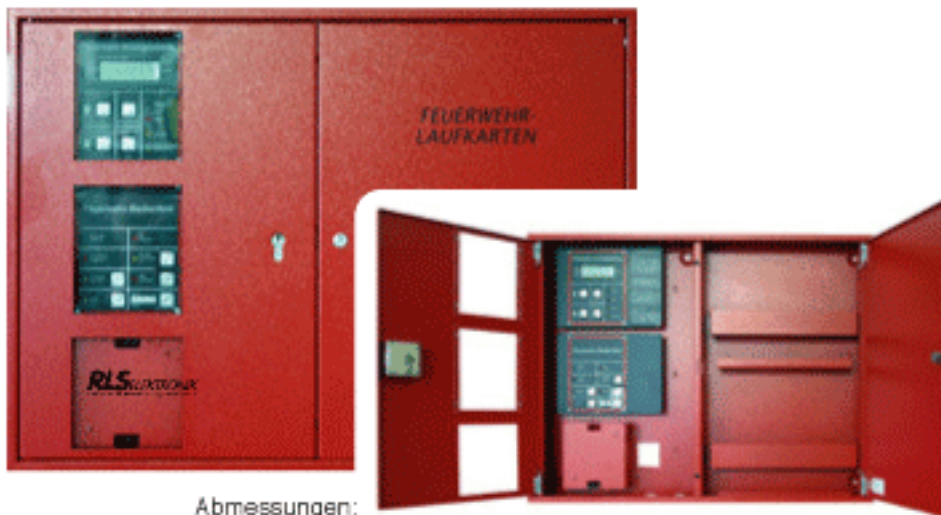
Abmessungen: B 770 x H 560 x T 80 mm (KD7-A4-80)