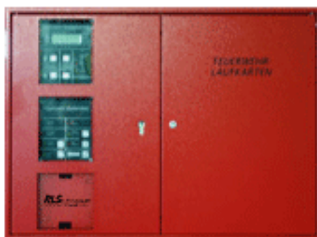
Infocenter KD 7